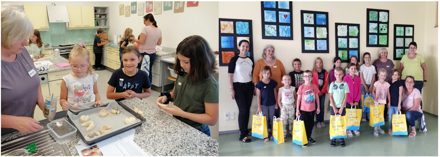
Essen ist fertig - Gemeindebedienstete