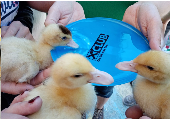
Erlebnis auf dem Bauernhof - Bauernbund und Bäuerinnen Haidershofen