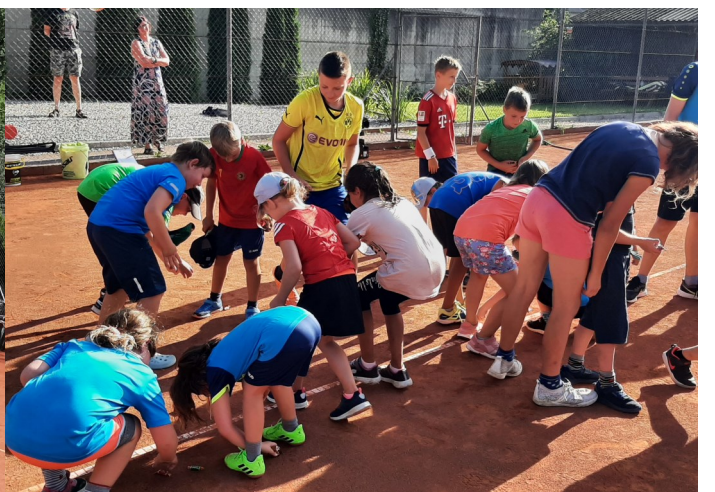
Spass an Tennis - UTC Raika Haidershofen