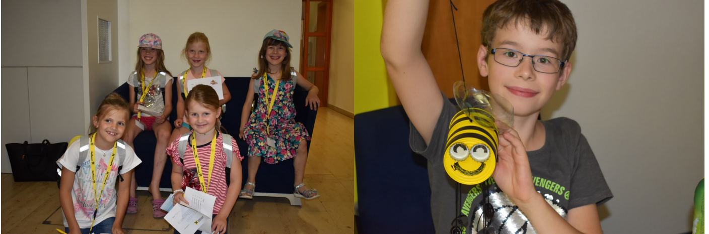
Zu Besuch bei Sumsi auf den Spuren von Dagobert Duck - Raiffeisenkasse Haidershofen

Mehr Fotos zu den Ferienspielen 2021 finden Sie unter www.haidershofen.gv.at