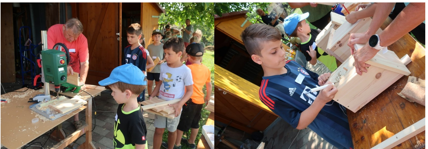
Nistkasten bzw. Schammerl bauen - Siedlerverein Haidershofen