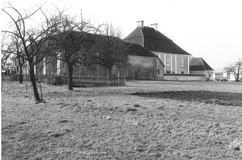
Pfarrhof mit Wirtschaftsgebäude vor Abbruch 1967