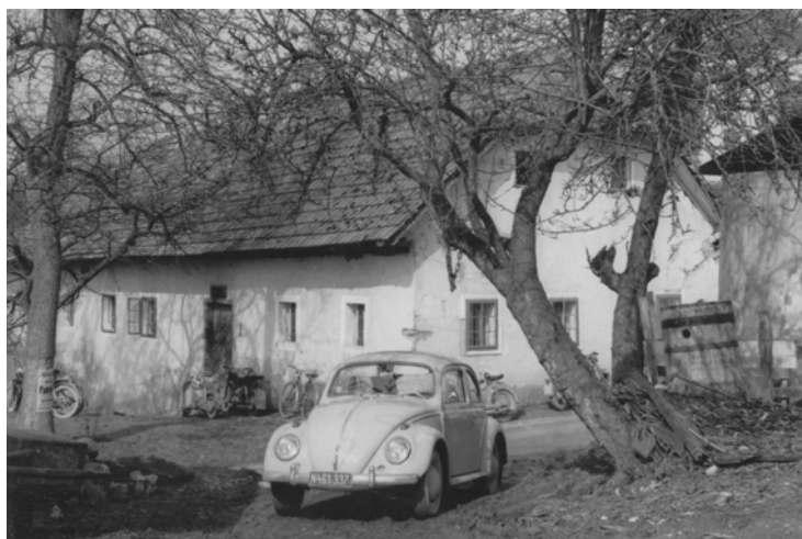
Altes Wagner-Haus, Im Ort 10, ca. 1955