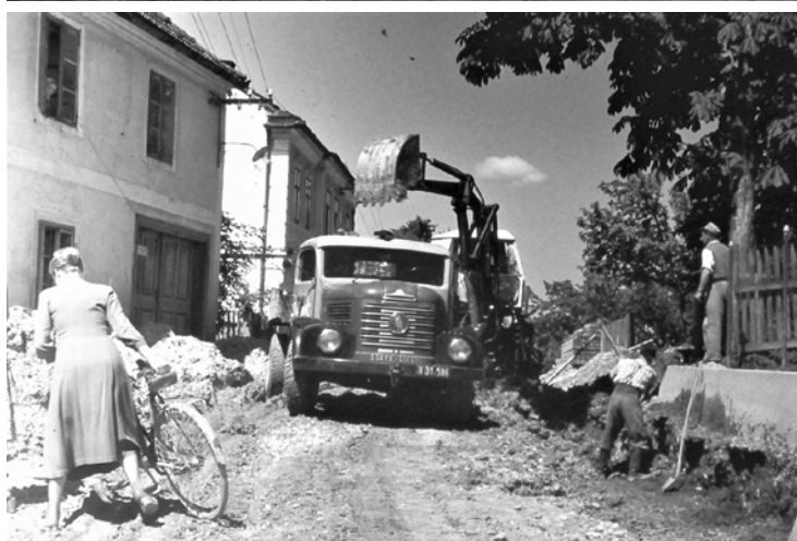
Straßenbau an der Westeinfahrt nach Biberbach, ca. 1960

(links: Kaufhaus Aigner – Jetzt Haus Helmelt, im Ort 227, links hinten: Haus Rauchegger / Humpelt jetzt Schoder, Im Ort 3)