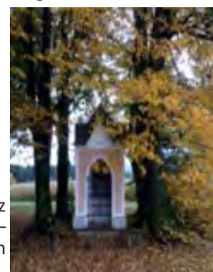
Foto: Helmut Berger: schönster Platz in der Gemeinde Etzerstetten – Kapelle des Hauses Sturmlehner in Figelsberg

Weiters gibt es einen Film im YouTube Kanal unter „Pfarre Steinakirchen“.