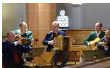
Foto: Markus Eder: Stubenmusik Berger musizierte bei der Festmesse.

https://www.servus.com/tv/videos/AA2499MF4JN1W12