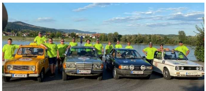
Gruppenfoto aller Teams aus Blindenmarkt