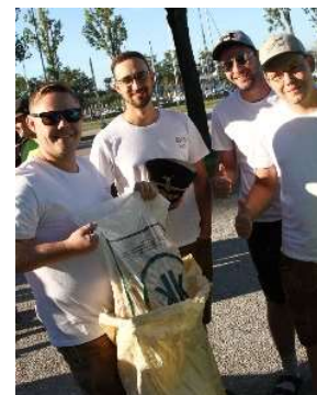
Team 21 - Nachtaufgabe erledigt in Mörbisch