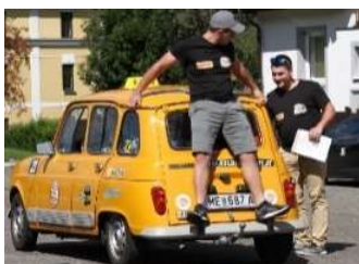
Team 23 bei der Geschicklichkeitswertung in Rottenmann