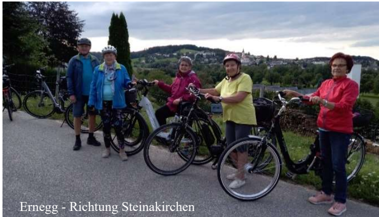
Ernegg - Richtung Steinakirchen