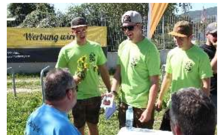
Team 17 Besorgungen erledigt in Krems