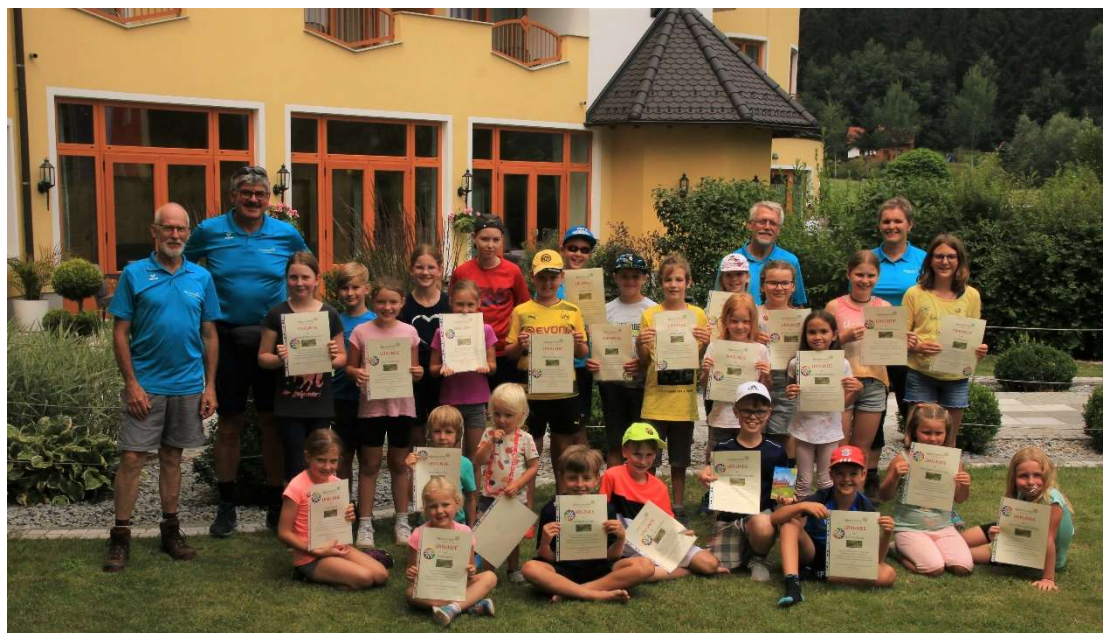
Eine wunderbare Wanderung!

Ein Gruppenfoto durfte natürlich auch nicht fehlen. Der Wirt der Aumühle sorgte für den Rücktransport eines Teils der Teilnehmer. Einige Kinder und Eltern entschieden sich jedoch für den Abstieg durch die Klamm, und das mit sehr viel Begeisterung bei den Kindern: „Wir haben jetzt den ganzen Alpenverein überholt!“, so die ganz Schnellen zu unseren Tourenführer der Ortsgruppe. Bewegung macht Spaß!