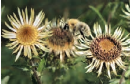
Ackerhummel

Tauchen Sie ein in die faszinierende Welt der Wildbienen bei einem Spaziergang durch die Doislau! In dem Schutzgebiet finden sich blumenreiche Wiesenbestände, auf denen besondere Orchideen gedeihen und die Lebensraum von seltenen Wildbienen und gefährdeten Schmetterlingen sind. Sie lernen außergewöhnliche Bienenarten und ihre Lebensweise kennen und erhalten nützliche Tipps zur bie-