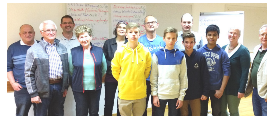
Gruppenfoto der TeilnehmerInnen beim SOLL-Workshop

notwendig die Seitenstettner Jugend bewusst einzubinden. So wurde ein offener Jugendworkshop in Verbindung mit der Landjugend überlegt und eingeladen. Bei diesem kamen neue jugendbezogene Wünsche nach Angebotserweiterungen dazu. Ein besonders großes Anliegen war ihnen, eine neue Heizung für den Landjugendraum, ein Volleyballplatz, eine bessere Ausstattung des Skaterplatzes und ein Jugendgemeinderat als regelmäßiger Treffpunkt zwischen Jugend und Ortspolitik.