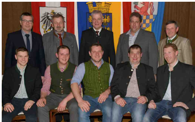
Foto: neuer Ortsbauernrat

Wir bitten Sie, diesen neuen Termin vorzumerken, und freuen uns, wenn Sie auch heuer wieder unseren Tag der Blasmusik mit uns feiern.