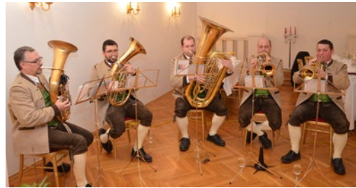
Feierliche musikalische Umrahmung mit den (S)Turmbläsern

Herzlichen Glückwunsch an alle Geehrten und ein Danke für euer Denken und Handeln für Seitenstetten.