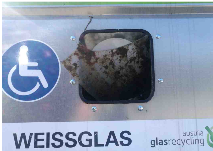
Verdreckte alte Fensterscheiben im Weißglascontainer!

Wir ersuchen Sie die Hinweistafeln am Altstoffsammelzentrum genau zu beachten um eine ordnungsgemäße Entsorgung aller Abfälle gewährleisten zu können und damit solche Fehlwürfe in Zukunft nicht mehr passieren.