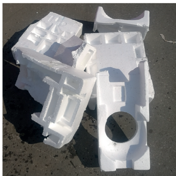
Bitte nur Styropor Verpackungsteile, sauber und ohne Klebebänder zum ASZ

Am ASZ wird das Verpackungsstyropor lose übernommen und ist in den entsprechenden Sammeleinrichtungen vom Anlieferer nach dem Zerbrechen einzubringen. Bitte beachten Sie, dass wir verpacktes Verpackungsstyropor in Säcken nicht übernehmen! Die Sammlung von Verpackungsstyropor bietet auch die Möglichkeit ein sortenreines Recycling durchzuführen. Daher ist das Übernahmepersonal am ASZ angewiesen, eine genaue Kontrolle durchzuführen. Die sortenrein gesammelten Verpackungskunststoffe werden direkt vom ASZ zum stofflichen Recycling transportiert.