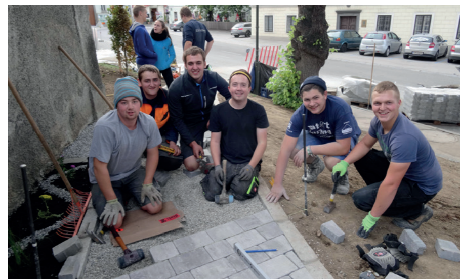
Die eifrigen Pflasterer der Landjugend: Die Arbeit ging den Burschen sehr gut von der Hand und machte ihnen auch noch Spaß.

pflanzen, ein Blumenbeet anzulegen und eine geeignete Sitzgelegenheit zu schaffen. An Arbeit herrschte also kein Mangel. Um das Projekt bis Sonntagnachmittag fertig zu haben, nutzten die Jugendlichen daher auch die Nacht.