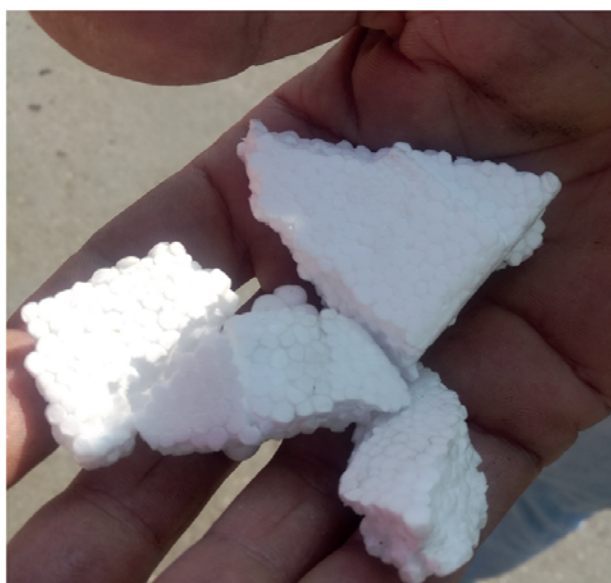
Styropor mit Kugelstruktur kann gut recycelt werden

Ab 1. Oktober 2018 gibt es an den Altstoffzentren des GDA die Möglichkeit, Styroporverpackungen abzugeben. Dabei geht es um Verpackungen aus Formstyropor, leicht zu erkennen daran, dass beim Brechen Kugelstrukturen entstehen. Damit ist sichergestellt, dass bei kurzfristigem großen Anfall von Verpackungsstyropor wie zum Beispiel beim Kauf von geschützten Elektrogeräten, eine Alternative zur Sammlung in den Gelben Säcken zu Hause besteht. Verpackungsstyropor in Form von Chips und Streifen ist nach wie vor über den Gelben Sack zu entsorgen.