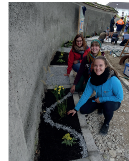
Die Blumenfeen sorgten für eine schöne Gestaltung der Beete.

Aber nicht nur auf der Baustelle gab es viel zu tun, sondern auch in Sachen Öffentlichkeitsarbeit. In einem Blog berichtete die Landjugend stets über den aktuellen Stand der Arbeiten.