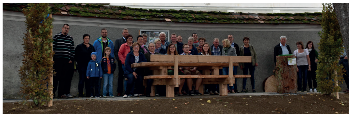
Am Sonntag wurde das neue „Schauplatzl“ von der Landjugend den Bürgern und Bürgerinnen präsentiert. Viele Seitenstettner nutzten die Gelegenheit das Werk zu bewundern und auch gleich auf der Holzgarnitur Probe zu sitzen.