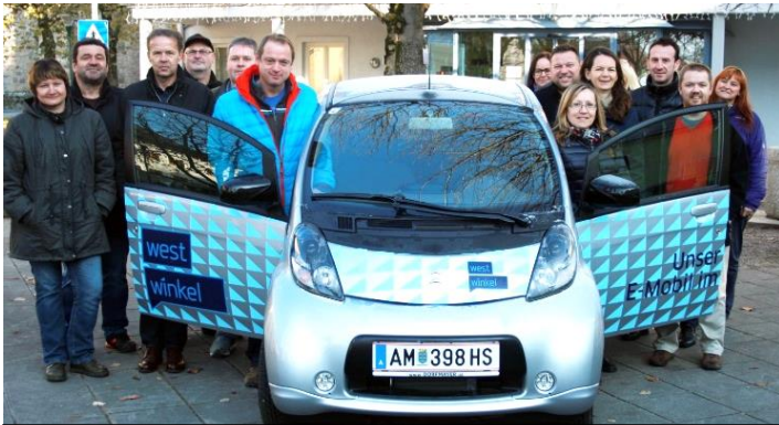
Das kostenlos auszuleihende E-Auto mit Westwinkelvertretern.

Eine Anmeldung ist ab sofort direkt am Gemeindeamt bzw. telefonisch (Tel.: 07432/2214) möglich.