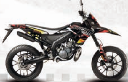
Senda DRD Racing 50 SM