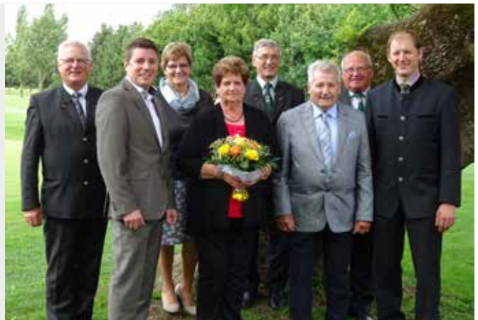
Nicht auf dem Foto: Pfarre Steinakirchen/F. und KOBV