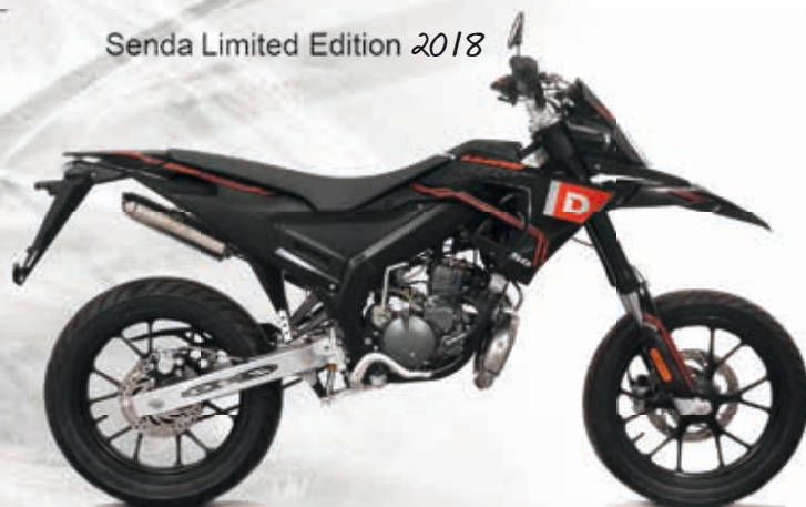
Senda Limited Edition 2018