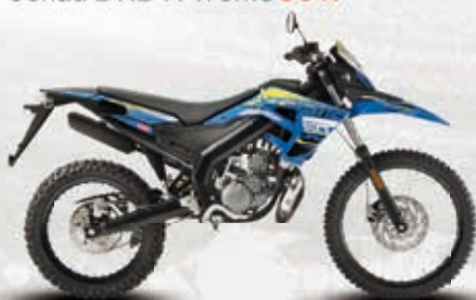
Senda DRD X-Treme 50 R

Motor: 1-Zyl-2-Takt Kühlung: Flüssigkeit Antrieb: 6-Gang Hubraum: 49 ccm Eigengewicht: 99 kg Sitzhöhe: 900 mm Tankvolumen: 7 Liter Max. Geschw.: 45 km/h Farben: Blau/Gelb