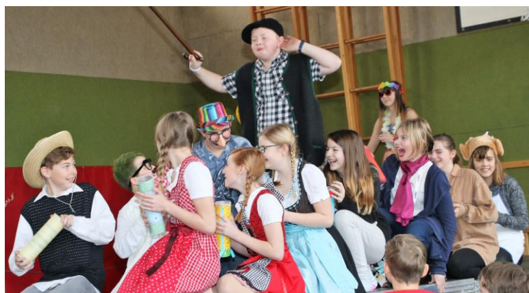
Die Kinder waren mit Begeisterung beim Catwalk dabei!