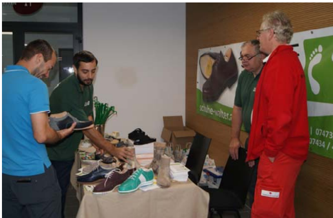
Orthopädie & Schuhe Walter