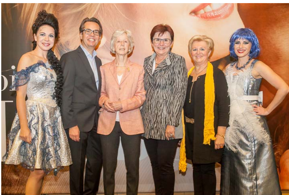
Helfen mit Kunst

Fast 450 benachteiligte Menschen besuchten die Vorstellung am 13. Oktober. Durch die Unterstützung von UMDASCH GROUP, ERDBAU HINTERHOLZER, LIONS MOSTVIERTEL, SV GROUP und EVENTASS bekamen die Gäste wieder Freikarten, Gratis-Anreise und -Verpflegung. Die KünstlerInnen und Sponsoren betreuten und umsorgten die BesucherInnen einmal mehr mit großer Umsicht. Für diesen karitativen Einsatz genießen die „Herbsttage“ große Anerkennung.