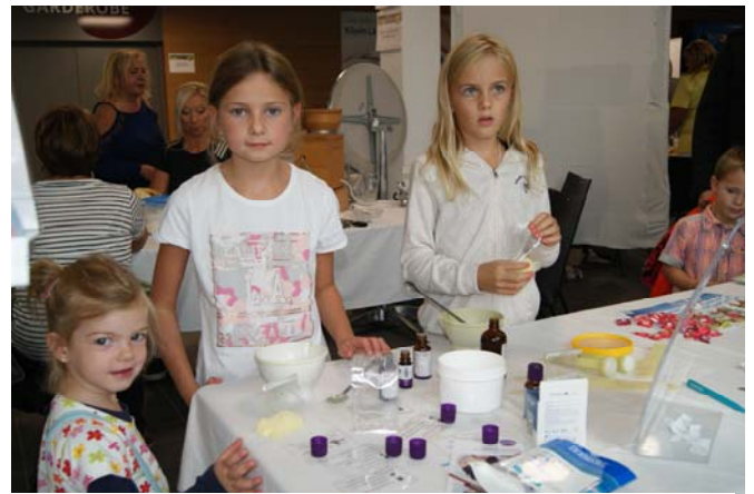
Badesalzerstellung erklärt von der Apotheke