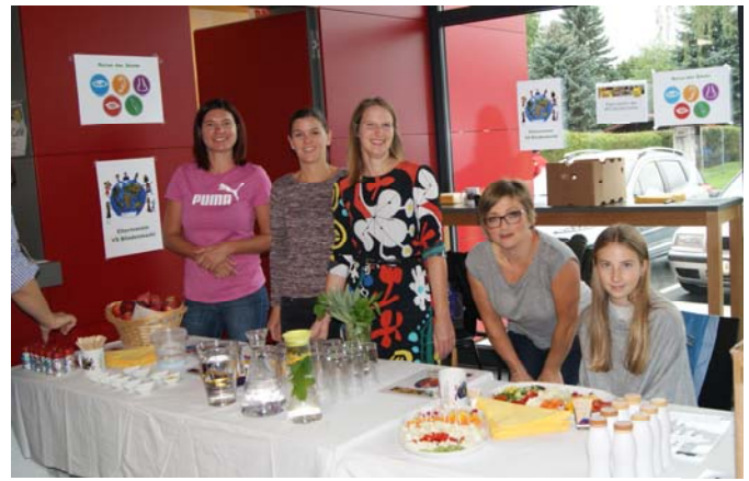
Elternverein der Volksschule Blindenmarkt