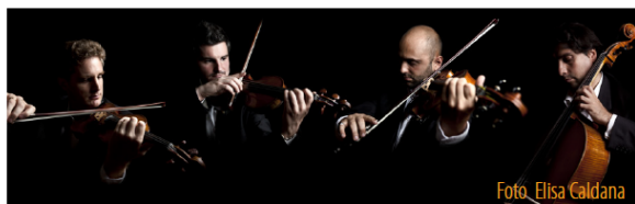
Quartetto di Cremona