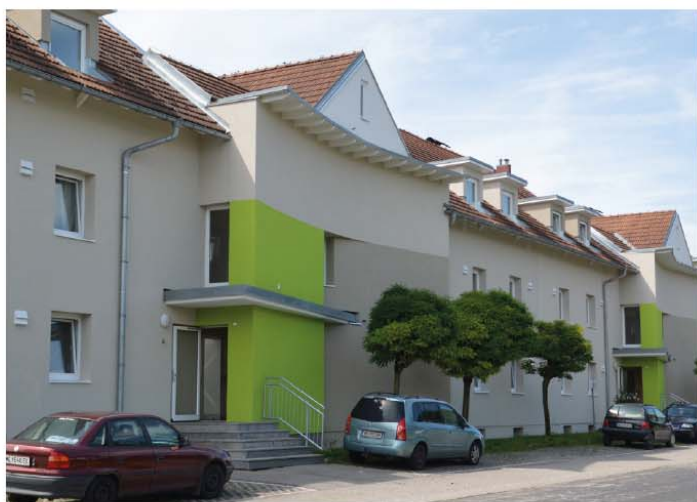
saniertes Wohngebäude der NÖ Wohnbaugruppe