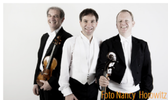
Altenberg Trio Wien