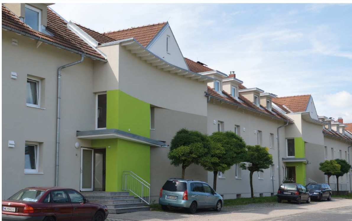
A: APM Architekten