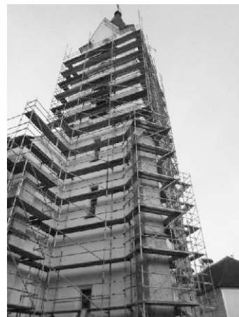
Blick auf den eingerüsteten Kirchturm

Seit rund einem Monat wird an der Außenrenovierung der Pfarrkirche fleißig gearbeitet. Nachdem die Kirche gänzlich eingerüstet wurde, sind nun die Dachdecker, die Maler und die Steinmetze am Werk. Für die Arbeiten ist folgende Kostenaufstellung vorgesehen: