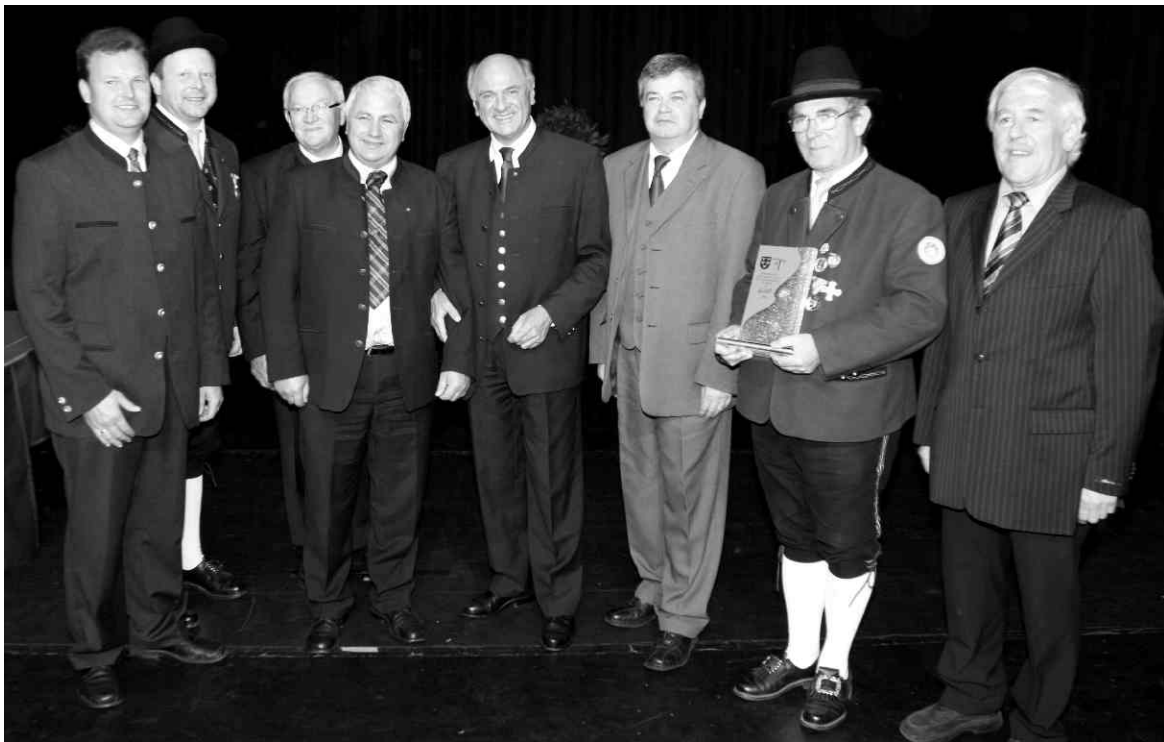
LH Pröll überreichte „Ehrenpreise in Silber“ an den Blasmusikverein Steinakirchen

Vier Ehrenpräsente in Gold, 76 in Silber und 32 in Bronze ist die Ausbeute der diesjährigen Ehrung von erfolgreichen Blasmusikvereinen in NÖ am 20. Mai im Kremser Stadtsaal durch Landeshauptmann Pröll persönlich. „Die Blasmusik, ein ständiger Wegbegleiter durch das ganze Jahr und eine wichtige Säule in der Jugend- und Kulturarbeit in NÖ“ betonte Landeshauptmann Dr. Erwin Pröll. „Musik stelle eine Brücke zwischen Menschen und Kulturen her und sei ein Beispiel für die Freiwilligkeit und Menschlichkeit im Lande.“