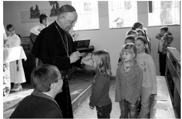
Kindersegnung in Wang