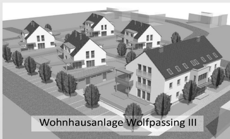
Wohnhausanlage Wolfpassing III

Bahnzeile 1 - 3500 Krems Tel.. 02732/83393 Fax: 02732/83393-51