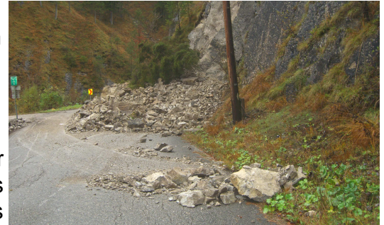
60 m 3 Material - Felssturz Zwieselbrücke

Beide Güterwege sind nun fertiggestellt und für den Verkehr freigegeben. Eine Zufahrt ist bis zum Bauernhaus Fahrlehen gestattet. Das Befahren des Radweges zwischen dem Bauernhaus Fahrlehen und der Blamau ist mit dem PKW nicht gestattet .