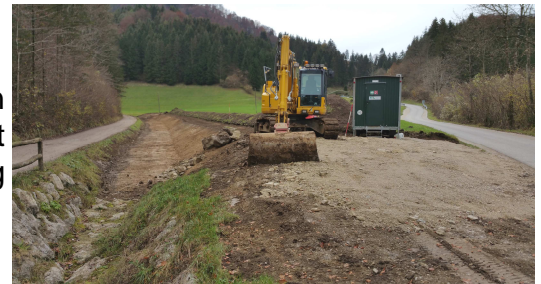
Baustelle Saurüssel Haitzmann

Das Gerinne des Hinterberggrabens wird entsprechend den ausgearbeiteten Hochwasserschutzmaßnahmen hergestellt sowie die bestehende Freileitung verkabelt. Mit Anfang Dezember sind die Baumaßnahmen abgeschlossen.