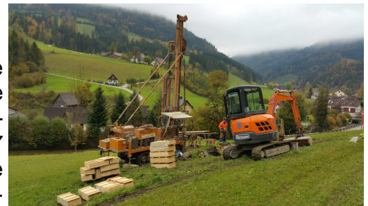
Kernbohrungen am Murenkegel

Im Anschluss an die Baggerschürfe wurden nun auch die notwendigen Kernbohrungen ausgeführt. Derzeit werden die Daten von der Wildbach- und Lawinenverbauung ausgewertet und in das Projekt eingearbeitet. Im Jänner 2017 wird das Projekt der Öffentlichkeit vorgestellt und die weiteren Schritte (Wasserrechts- und Finanzierungsverhandlungen) in Angriff genommen.