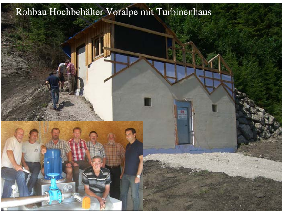
Rohbau Hochbehälter Voralpe mit Turbinenhaus

Die Bauarbeiten für die Errichtung der neuen Trinkwasserversorgungsanlage sind soweit fortgeschritten, dass die Trinkwasserturbine bereits seit Anfang August im Probetrieb läuft. Geplant ist, ab Mitte September die gesamte Wasserversorgungsanlage provisorisch zu betreiben.