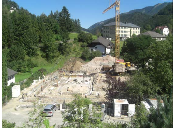
Blick auf die Baustelle „Kindergartenneubau“

Nachdem im Juli das alte Kindergartengebäude geräumt wurde, konnte Anfang August mit den Abbrucharbeiten begonnen werden. Unser Bauzeitenplan sieht vor, dass im September die Fundamentierungs- und Unterbauarbeiten, im Oktober die Zimmermanns- und Dachdeckerarbeiten durchgeführt werden, so dass in den Wintermonaten die Installationsarbeiten in Angriff genommen werden können. Der neue Kindergarten soll dann zu Kindergartenbeginn des Kindergartenjahres 2011/12 fertig gestellt sein.