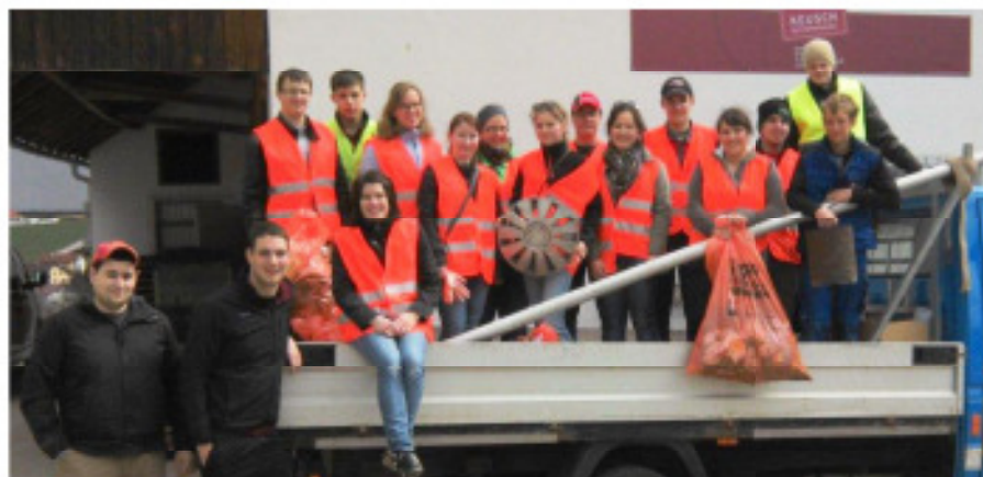
Landjugend, Junge ÖVP und Katholische Jugend

Insgesamt 4 Jugendgruppen – die Landjugend, die Junge ÖVP, die Katholische Jugend und der Jugendlauftreff – reinigten entlang der Landesstraßen und Gemeindestraßen die von Müll besäten Straßenränder. Die Jugendlichen und Kinder stellten damit unter Beweis, dass ihnen der Umweltschutz ein wichtiges Anliegen ist. Ein herzliches Dankeschön den vielen Freiwilligen!