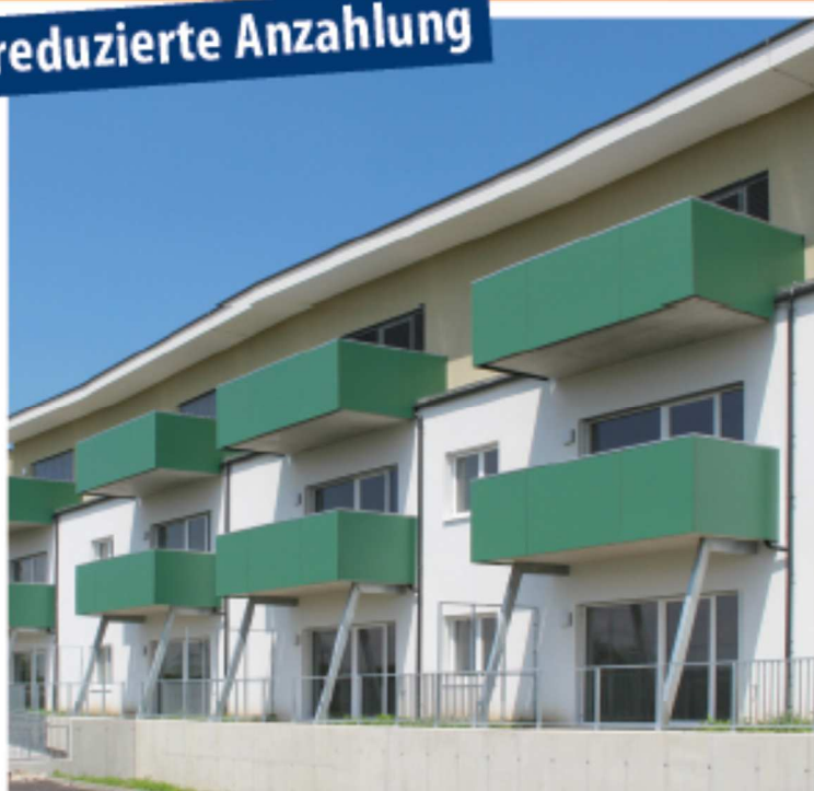
A: Plan-Bau Design GmbH