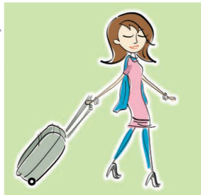
Illustration: Fanatic Studio - Thinkstock.com, Bearbeitung: GEWINN

Fiaker in Wien im Jahr 1859 1.149 2005 301 2013 194 Erste Fiaker-Lizenz in Wien im Jahr 1693