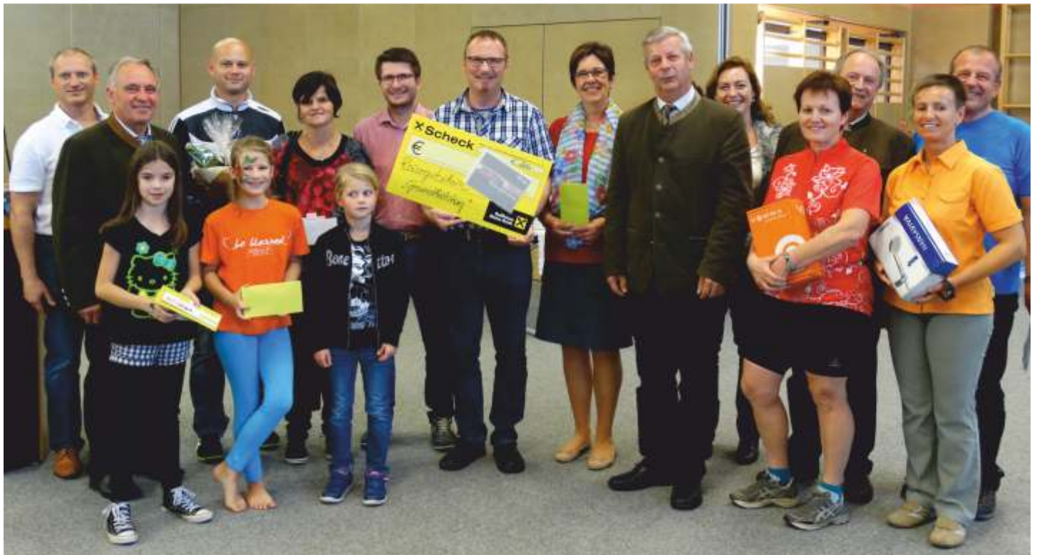
Die Gewinner, Sponsoren, Aussteller und Organisatoren des Gesundheitstages der Gesunden Gemeinde Allhartsberg.

Ein großes Dankeschön ergeht an alle Mitwirkenden des Gesundheitstages, den Sponsoren für die Sachspenden, der Volks- und Mittelschule und den Besuchern.