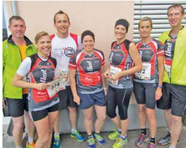
Die erfolgreichen TeilnehmerInnen beim Businessrun

Wenn auch DU mit uns laufen möchtest, komm einfach montags im Sommer um 19.00 Uhr zum Beachhaus in Oed!