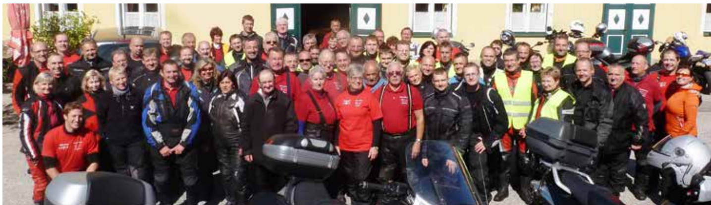
Gruppenbild 18. Ausfahrt

Kilometern konnte dank der hohen Disziplin aller Beteiligten sowie der Hilfe der Gelben Engel wieder eine unfallfreie Ausfahrt verzeichnet werden.