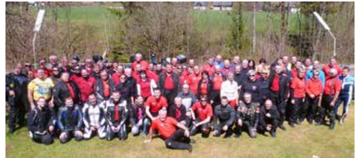
Gruppenbild 17. Ausfahrt

Bei dieser Gelegenheit möchten wir uns bei allen Bikern für die hohe Disziplin innerhalb der Gruppe bedanken, sowie bei den „Gelben Engeln“ für ihren Einsatz um ein flüssiges und sicheres Fahren ermöglichen zu können.