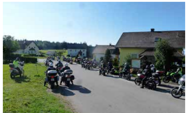
18. Ausfahrt - Bärnkopf

Perfekt! Recht viel mehr kann man zu der 18ten Ausfahrt der Motorradfreunde Wolfsbach wohl nicht sagen. Sie musste zwar wegen Schlechtwetter vom 5. September 2015 auf den 12. verlegt werden, doch diesmal hat das Wetter mitgespielt. Auch wenn es in der Früh noch ziemlich kühl war wurde es im Laufe des Tages immer wärmer und bei der zweiten Kaffeepause wollten so manche schon gar nicht mehr