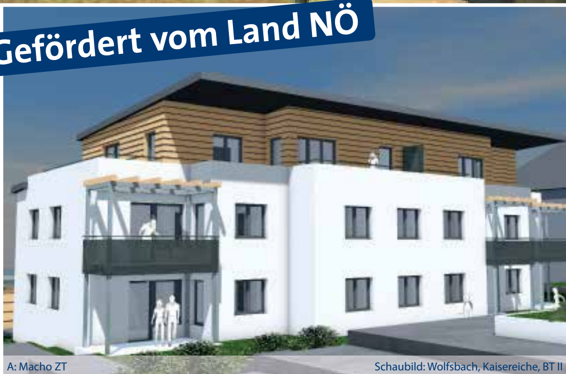
A: Macho ZT