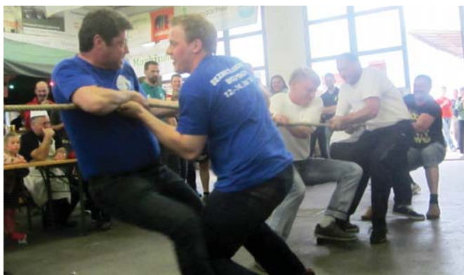
Doping mit Schafkäse führte die „Schofkas-Buam“ auch beim Seilziehen gegen den Musikverein Wolfsbach zum Erfolg.

Ernennungen und Ehrungen / Die FF-Aschbach nahm das 130-jährige Bestehen zum Anlass für die Durchführung von Leistungsbewerben. Beim anschließenden Abschnitts-Feuerwehrtag wurden