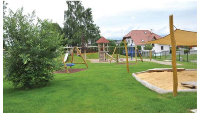
Neuer Spielplatz am Sonnenhang

Der öffentliche Spielplatz am Sonnenhang ist nach Anwachsen des Rasens ab sofort für alle Kinder bespielbar.