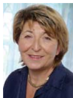
Herta Kaufmann Immobilienvermittlung