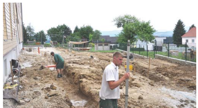
Erste Arbeiten beim Kdg - Zubau

Die Arbeiten begannen planmäßig am 8. Juni 2015 und werden zügig fortgesetzt.