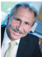
Karl Streicher Immobilienvermittlung