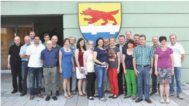
Teilnehmer des Vereinsinfoabend

Damit wollen wir erreichen, dass alle Vereine bestens informiert sind. Denn unsere aktiven Vereine prägen das Gemeindeleben und sind für die Gemeinde unverzichtbar.