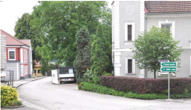
Kreuzungsbereich Familie Weixelbaumer

Wie sie sicher wissen, ist der Haupteingang des Kindergartens beim ehemaligen Kriegerdenkmal geplant, um die Verkehrssicherheit zu erhöhen. Es wird in Zukunft nicht mehr möglich sein und geduldet werden, im Kreuzungsbereich beim Haus der Familie Weixelbaumer das Auto zu parken. Ich bitte um Ihr Verständnis!