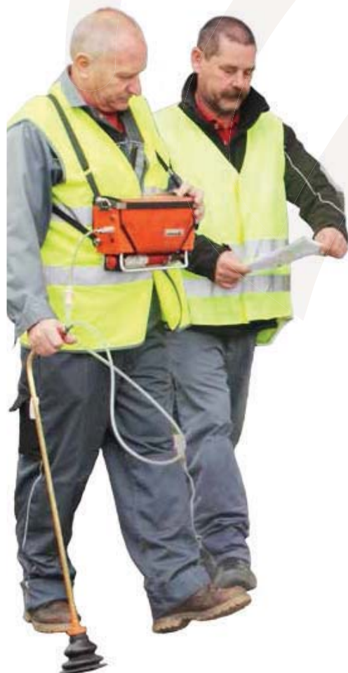
Das Messgerät erfasst auch kleinste Mengen Erdgas.

Das sogenannte Gasspüren funktioniert ohne Aufgraben und völlig berührungsfrei: Die Leitung wird Zentimeter für Zentimeter abgegangen und dabei mithilfe spezieller Geräte gemessen, ob sich Gas in der Luft befindet. Je nach verwendetem Rohrmaterial wird so die Dichtigkeit alle 2 bis 9 Jahre überprüft.