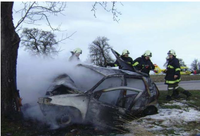
Nachlöscharbeiten am Unfallfahrzeug

Samstag, 01. Februar 2014, 14:40 Uhr - die Sirene heult, „Menschenrettung mit einer eingeklemmten Person“ lautet der Alarmtext. Schnellstmöglich wird das Löschfahrzeug mit Bergeausrüstung zum Einsatzort in der Nähe der Autobahn gelenkt. Kurz vor dem Erreichen der Einsatzstelle: „Oh mein Gott - das Fahrzeug steht bereits in Vollbrand“. 2 Kameraden laufen mit Feuerlöschern zum brennenden Auto und unternehmen erste Löschversuche. Und endlich das große Aufatmen. Passanten, die den jungen Männern zu Hilfe gekommen waren, informierten uns, dass sich keine Personen mehr im Fahrzeug befinden.