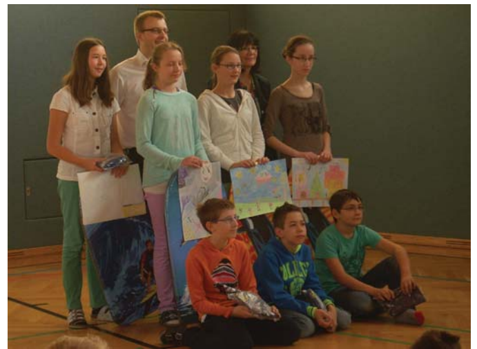
Die NMS Wolfsbach nahm auch heuer wieder am Zeichenwettbewerb der RAIBA teil.