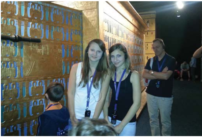
Am 25. April 2014 besuchte die 4. Klasse die Ausstellung zum Thema TUTANCHAMUN in Linz.