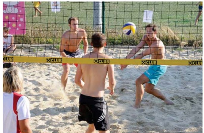
Sommer – Sonne – Sonnenschein!

Aufgrund des verregneten Mai's wurde der Beachvolleyballplatz heuer erst am 29.05.2014 offiziell eröffnet. Seither gab es wieder genug Möglichkeiten um Beachfeeling in der Sonne zu genießen.