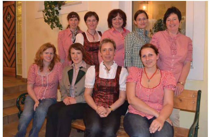
Wahl 2014 Ortsbäuerinnen: