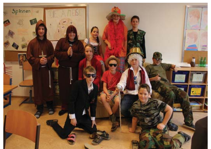
FaSchHiNg In DeR nMs