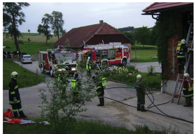
Über eine Leiter wurden die Übungsdarsteller vom 1. Stock des Wirtschaftsgebäudes gerettet.