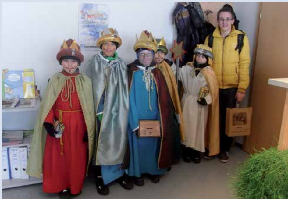
Bild: Die Sternsinger/innen verkleidet als Caspar, Melchior & Balthasar überbringen dem Gemeindeamt den Segen für das Jahr 2014.

Die Gemeinde Ennsdorf möchte sich auf diesem Wege bei allen freiwilligen Sternsinger/innen für ihren Beitrag zu einer besseren Welt bedanken!