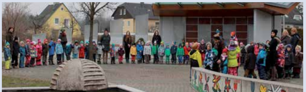
Bild: Kindergartenkinder zu Besuch am Gemeindeamt.

Die Gemeindebediensteten bedankten sich bei allen Kindern recht herzlich für die nette Überraschung und wünschten allen Kindern ein braves Christkind.