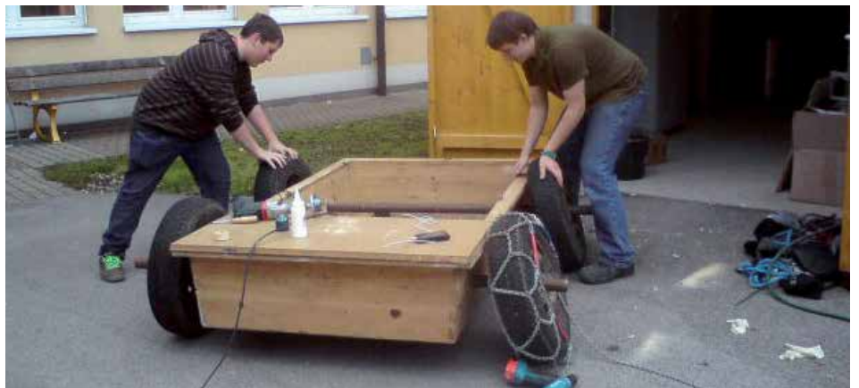
Bild: Aus alten Kastenteilen, Autoreifen und Metallmüll entsteht ein Auto. Dieses wird bei den Aufführungen ab Ende April verwendet.

seiner Schule: „Sie beweisen dadurch, dass auch die „heutige Jugend“ bereit ist, sich zu engagieren. Eine besondere Freude ist für mich, dass Jugendliche aus unserer Schule und dem Realgymnasium gemeinsam an diesem Projekt arbeiten.“