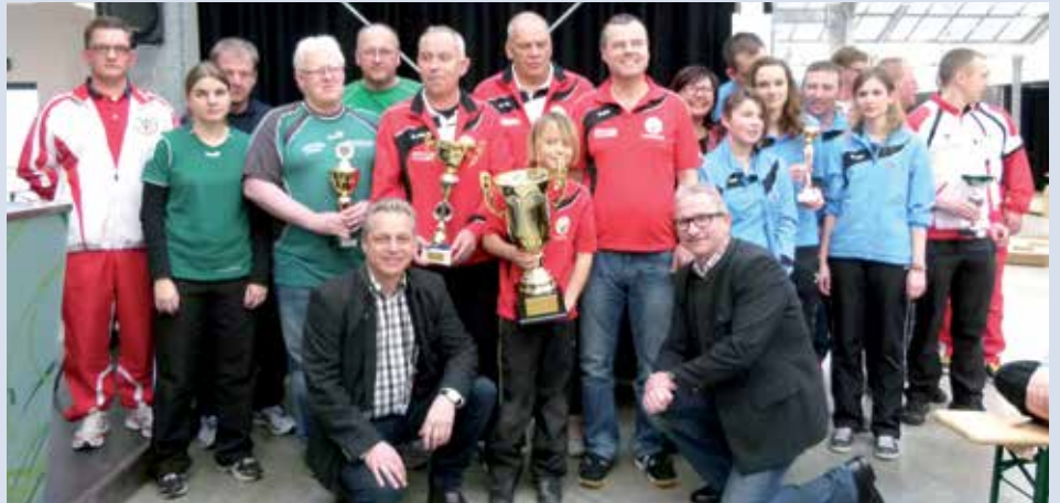
Bild: Siegerehrung - Gesamtbild