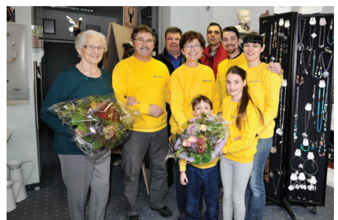
40. Jahre Fachgeschäft Keferböck