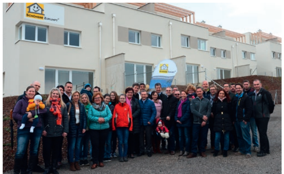
Im Rahmen der feierlichen Schlüsselübergabe wurden den Mietern die Reihenhäuser bzw. die Wohnungen übergeben

Ich möchte mich beim Gemeinderat für die Disziplin bei den Beschlüssen und seinen Weitblick recht herzlich bedanken. Dadurch konnten wir wieder unsere Pro-Kopf-Verschuldung senken und somit einen wichtigen Beitrag für die nachhaltige Entwicklung der Marktgemeinde leisten.