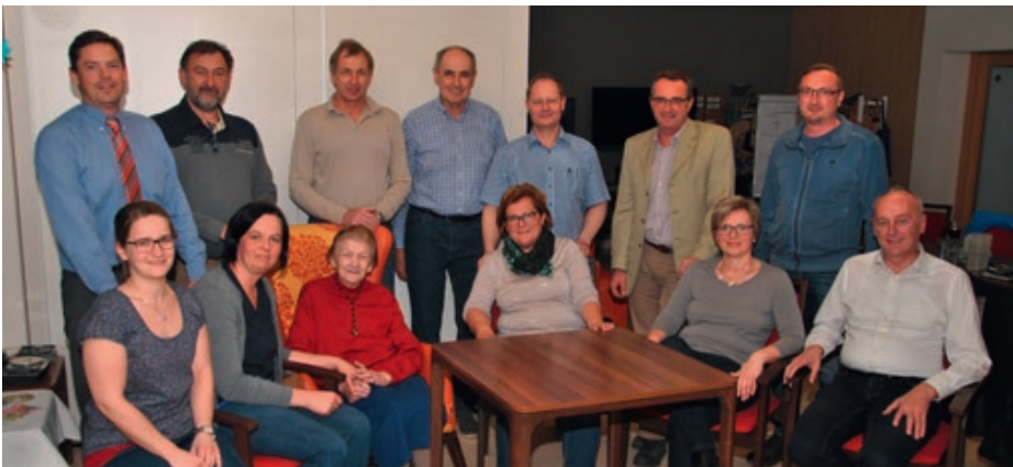
Der Vorstand des Seniorentageszentrums freut sich auf Ihren Besuch beim Tag der offenen Tür und beim Maibaumaufstellen.

stattfinden. Wir freuen uns auf Ihren Besuch!