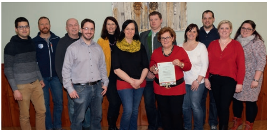
Der neu gewählte Vorstand des Dorferneuerungsvereines St. Georgen am Ybbsfelde.