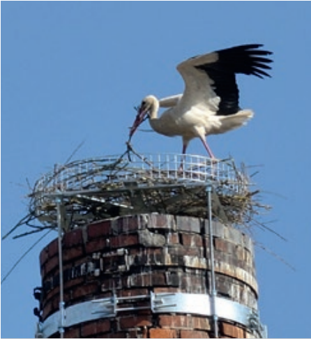
Der Storch hat wieder nach St. Georgen am Ybbsfelde gefunden und sich im Nest am Schornstein niedergelassen

chen. So wird z.B. ein Gehsteig von der Siedlungseinfahrt zum Buswartehaus miterrichtet. Im Moment wird