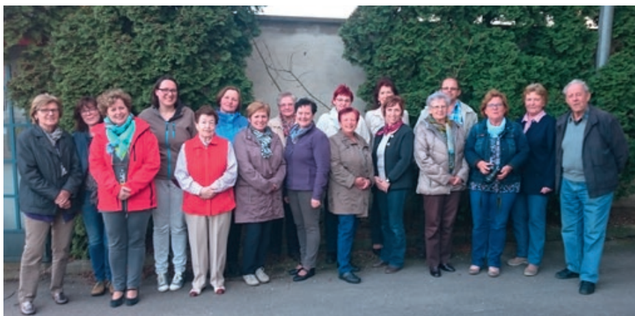
Die Marktgemeinde St. Georgen dankte im Rahmen des Dankesfestes den Betreuern der zahlreichen öffentlichen Plätze im Gemeindegebiet.