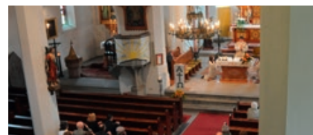
Die hl. Messe für die Jubelpaare des Jahres 2016 findet am 4. Juni 2016 statt.

um 17:00 Uhr in der Pfarrkirche statt. Dazu sind alle Mitbürger herzlich eingeladen! Musikalisch umrahmt wir die hl. Messe vom Chor SEHO.