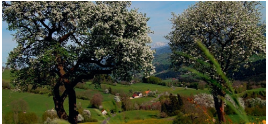
Die Gesunde Gemeinde St. Georgen am Ybbsfelde lädt herzlich zum Vortrag „Nachhaltiger Lebensstil“ am 21. April 2016 ein.

Nachhaltigkeit beginnt beim Hinterfragen eigener Verhaltensweisen, Gewohnheiten und Konsumententscheidungen. Beispielsweise wenn wir uns schon vor dem Einkauf fragen, ob wir ein Produkt überhaupt brauchen oder doch das Alte weiterverwenden können und so Ressourcen schonen.