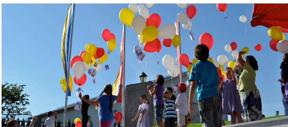
Beim Luftballonsteigen wurden Ballons in die weite Welt geschickt. Es sind schon einige Karten am Gemeindeamt eingetroffen. Mit der Bekanntgabe des Siegers (Ballon dessen, der am weitesten flog oder noch fliegt) wird noch gewartet.