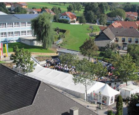
Karl Bruckner nutzte die Möglichkeit und fotografierte vom Kirchturm aus das Festgeschehen.