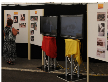
In einer Fotoausstellung wurden Bilder der Markterhebung, der Marktfeste und der Entstehung des Marktplatzes in den letzten Jahrzehnten gezeigt.