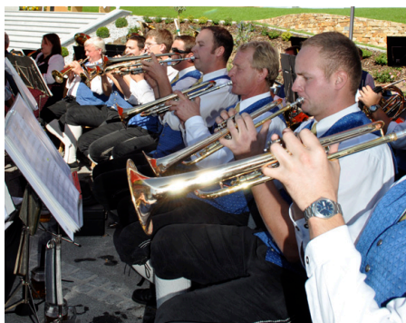
Die Trachtenkapelle St. Georgen am Ybbsfelde begleitete die Hl. Messe, Festakt und Frühschoppen.