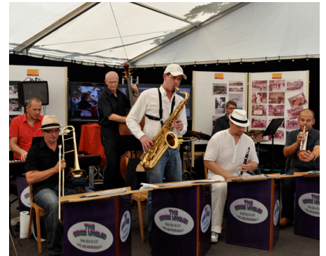
"The Dixie Uncles" sorgten am Nachmittag für gute Stimmung.