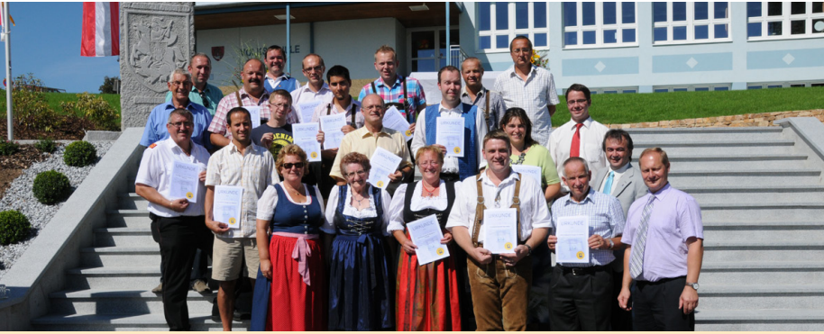
Anlässlich des europäischen Jahres der freiwilligen Tätigkeit wurden Vereinsobleute mit einer Urkunde, unterzeichnet von LH Dr. Erwin Pröll, geehrt. Außerdem gab es einen Anstecker mit dem Marktwappen.