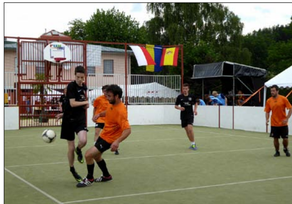
Die engagierten Sportler beim Turnier

„Es ist zu hoffen, dass unsere Jugend das Badareal mit Volleyballplatz und Funcourt weiterhin so zahlreich nutzt.“