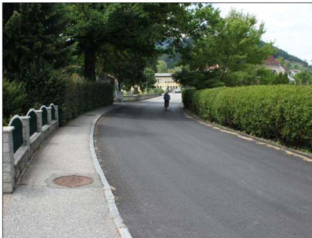
Die neu asphaltierte Schulstraße und die verlängerten Gehsteige entlang der Wäldraud Welsers-Stockporthalle.

Inzwischen wurde auch die Verlängerung des Gehsteiges entlang der B22 fertiggestellt, der seitens der Marktgemeinde Gresten mit Hilfe der Straßenmeisterei Gaming errichtet wurde.