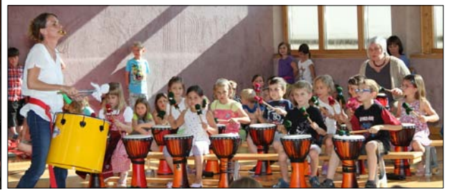
Ausstellung und Vorführungen in der Schule, der Schülerchor beim Festakt, Flugvorführung des MFC Eisenstraße in der Waltraud Welsch-Sportschule - für ein buntes Programm war gesorgt (oben). Die Festgäste amüsierten sich nicht nur in der Halle, sondern auch in den Gastgärten der Grestner Wirte (unten).