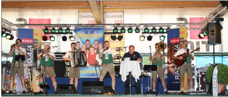
Die Krieglacher spielten auch im Rahmen der Radio 4/4-Sendung groß auf.