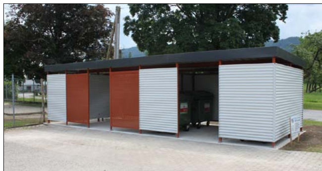
Die neue Müllplatzeinhausung beim Badparkplatz.