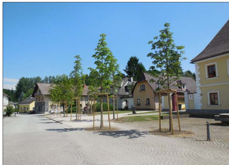
Die „neuen“ Kastanien schmücken den Oberen Markt.

welche von der Gärtnerei Käfer durchgeführt wurde. Inzwischen präsentiert sich der Obere Markt wieder als wunderbarer Ortsteil.