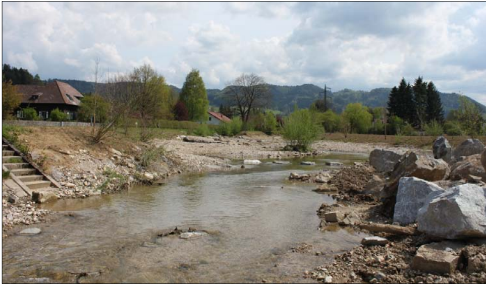
Das Ökoprojekt bestand seine erste Bewährungsprobe bei den Hochwässern im Mai 2014.

Angespornt durch die hohe Akzeptanz des Ökoprojekts Nord und der Tatsache, dass ein angedachtes Rückhaltebecken im Bereich Zellhof/Brettel wegen fehlender Zustimmung einiger Grundeigentümer für eine Umsetzung derzeit nicht realistisch erscheint, habe ich dem Gemeinderat nach Rücksprache mit der Abteilung WA3 und unserem Planungsbüro Perzplan die Beauftragung einer Maßnahmenstudie für alternative kleinräumige bzw. Linearmaßnahmen eines Ökoprojekts Gresten Süd vorgeschlagen. Die Beauftragung erfolgte durch den Gemeinderat.