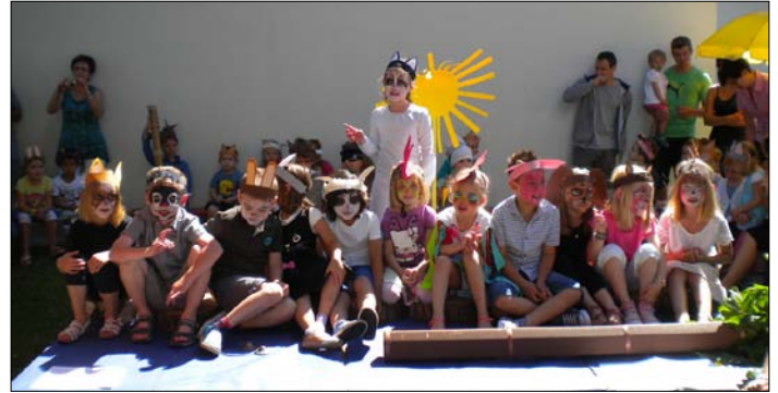
Die Theaterdarsteller und die Kinder mit den Warnwesten.

Die Kinder bedankten sich bei einer kleinen Feierrunde mit dem Katzentanzentanz.