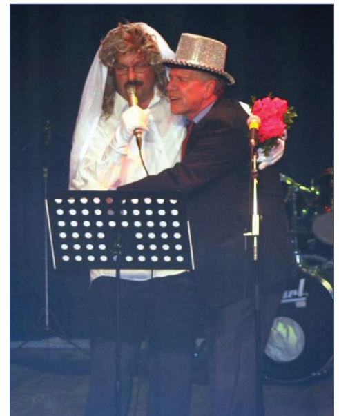
Das „Liebesgütchen“ zwischen Gresten und Gresten-Land wurde bei der Schlagernacht mit der „Hochzeit“ proklamiert!

Die Amtlichen Nachrichten werden jedem Haushalt zugestellt! Das heißt: In der Marktgemeinde Gresten bekommen alle 1000 Haushalte diese Zeitung, weitere 100 Zeitungen werden per Anschrift versendet, also um 400 Haushalte mehr als bei normalen Postwurfsendungen! Außerdem ist die Zeitung im Internet nachzulesen.