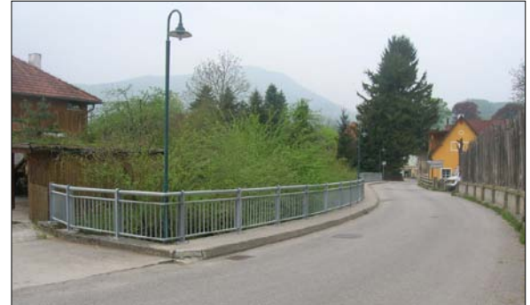
Das neue formschöne Geländer am Joisingweg

gegebener finanzieller Möglichkeit die Sanierung der Schulstraße im Bereich BILLA in einem weiteren Nachtragsvoranschlag noch im Herbst dieses Jahres zu berücksichtigen.