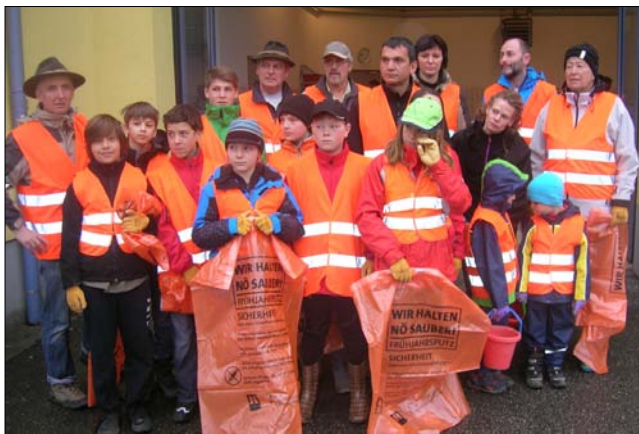
Erfreulich, die große Anzahl der Kinder, die sich an der Aktion beteiligten

dieser Säuberungsaktion, und speziell der Freiwilligen Feuerwehr Gresten!