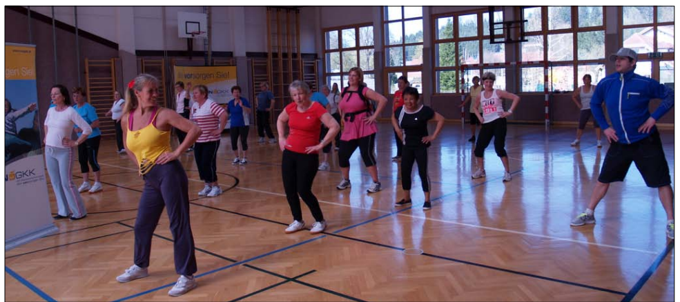
Eifrig und mit flotten Bewegungen beteiligten sich die Damen und Herren an den vorgegebenen Übungen