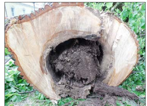
Stellenweise wurde der Baum nur mehr von einer 5 cm breiten Randschicht getragen