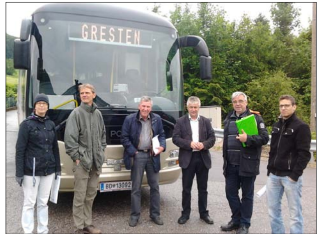
Mit einem leeren Postbus wurden beim Lokalaugenschein die Möglichkeiten einer Bushaltestelle eruiert

Die benötigten Grundstücksflächen und den Plan erläuterte Ing. Hammerl (Abt. ST6).