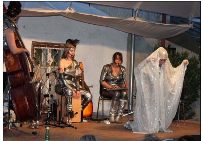
Die „Neobrenndirndl“ - fünf Damen aus der Region Scheibbs-Wieselburg - beeindruckten mit ihrem neuen futuristischen Musikkabarett