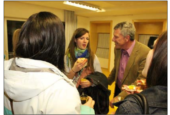
Der Bürgermeister beim Small Talk mit den Jugendlichen