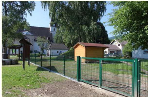
(ob.) Zugang zum neu errichteten Gehsteig und (unt.) neue Einzäunung des erweiterten Kindergartens.