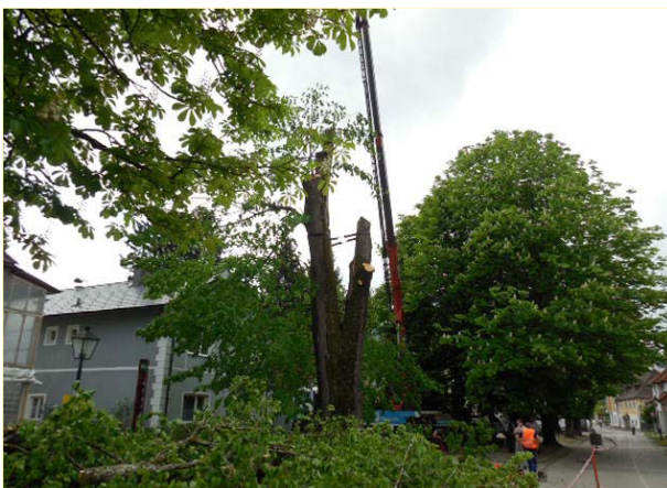
Die Fa. Hubegger entfernte die schadhafte Linde fachgerecht

Kinder entschärft. Das Kindergartenareal – der neue Gehsteig wurde auf Kindergartengrund errichtet – wurde dafür auf der Ostseite erweitert, damit die Größe der bisherigen Spielfläche auch weiterhin für die Kinder zur Verfügung steht. In den