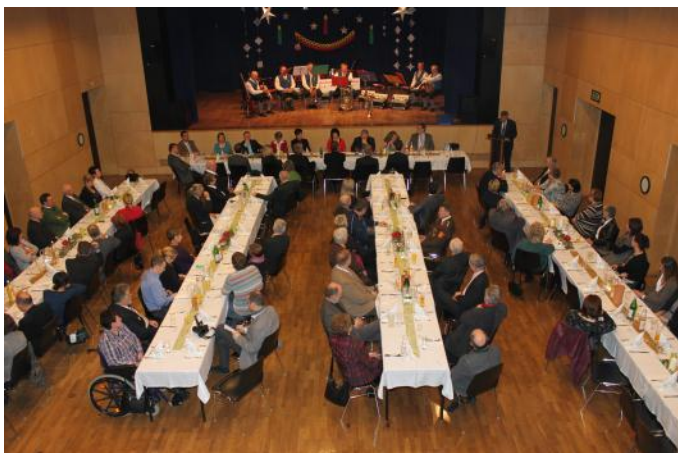
Andächtig lauschten die geladenen Gäste der Festansprache.

Um den Jahreswechsel lädt der Bürgermeister der Marktgemeinde Gresten den Gemeinderat und zahlreiche Ehrengäste zur traditionellen Festsitzung.