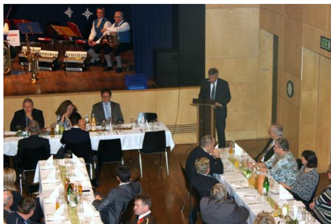
Bürgermeister Wolfgang Fahrnberger bei der Festrede