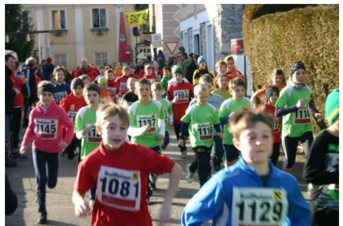
Lauffreudige Schüler in Aktion, Foto: Naturfreunde Gresten