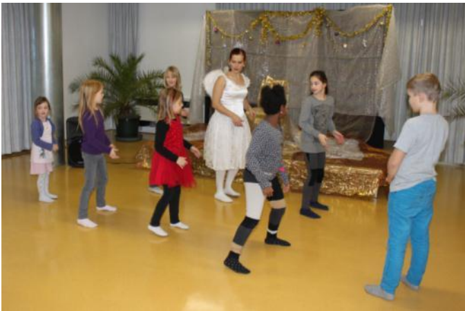
Engelhafte Tanzreise im Vereinsraum

Am 22.12.2012 wurden die anwesenden Kinder von herausragenden KünstlerInnen mit ihren vielfältigen Programmen bestens unterhalten und auf Weihnachten eingestimmt.