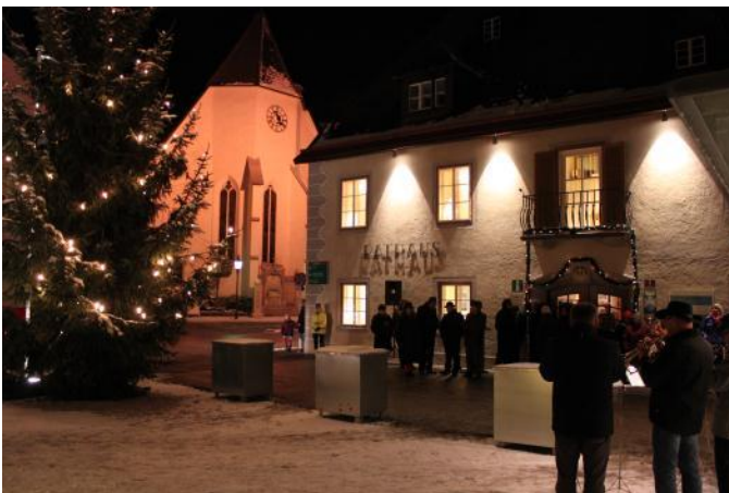
Vorweihnachtliche Stimmung am Rathausplatz zur Einweihung des neu sanierten Rathauses

Am 07.12.2012 konnten sich die BesucherInnen im Rahmen eines Tages der offenen Tür selbst ein Bild von den durchgeführten Umbau- und Sanierungsarbeiten im Rathaus machen. Bei Imbiss und Getränken konnte man mit dem Bürgermeister plaudern.