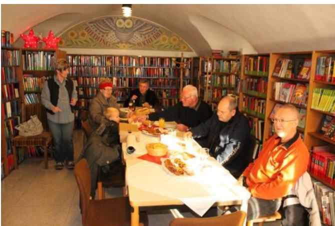
Gemütliches Beisammensein in der Bücherei

Am 07.12.2012 konnten sich die BesucherInnen im Rahmen eines Tages der offenen Tür selbst ein Bild von den durchgeführten Umbau- und Sanierungsarbeiten im Rathaus machen. Bei Imbiss und Getränken konnte man mit dem Bürgermeister plaudern.