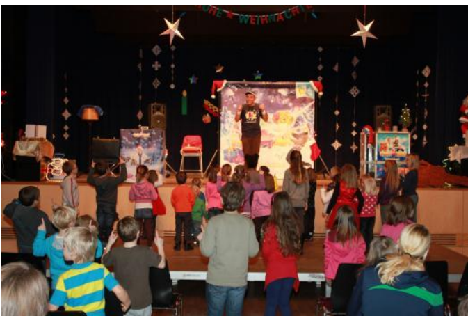
Gute Laune im Saal der Kulturschmiede, Foto Reinhold Kefer