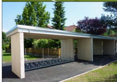
Die letzten Arbeiten vor Fertigstellung des neuen Schulareals!