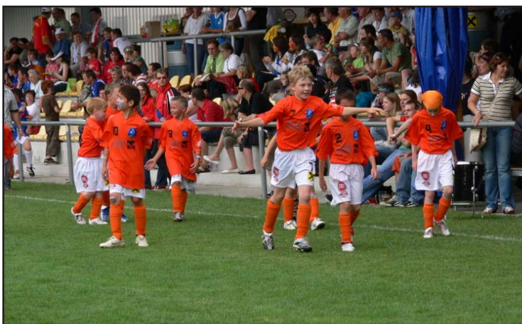
Die Oranjes aus Wieselburg feierten nach einem Torerfolg....