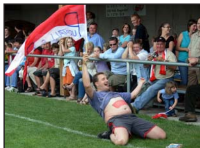
....die Purgstaller Fans wussten zu feiern....