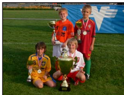
.....die Kapitäne der vier besten Teams.....