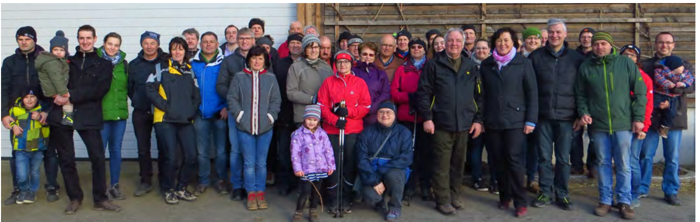
Foto: Das Interesse an den beiden Betrieben war bei Jung und Alt groß