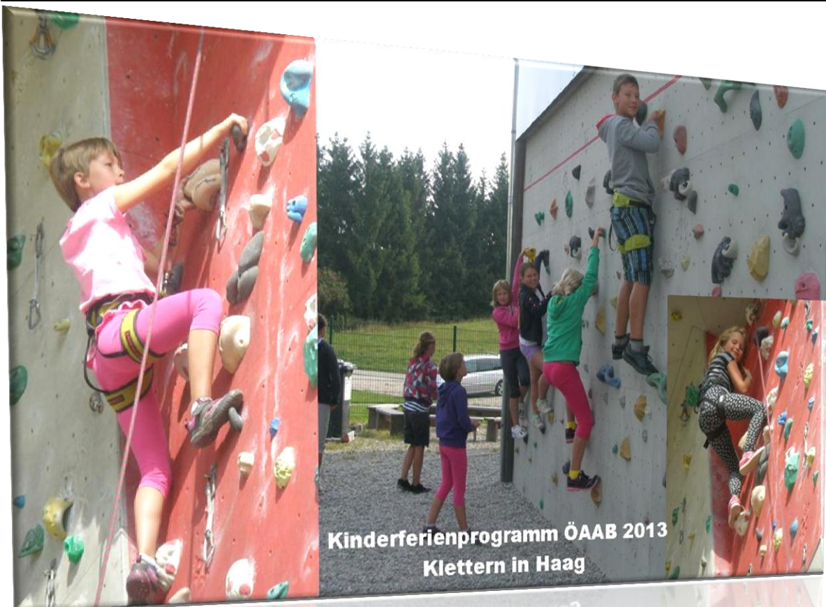
Kinderferienprogramm ÖAAB 2013 Klettern in Haag