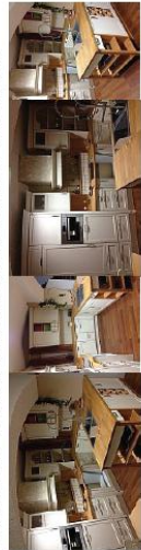
Landhaus KORNMÜLLER KÜCHE inkl. E-Geräte