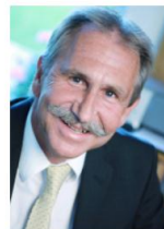
Karl Streicher Immobilienvermittlung