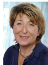
Herta Kaufmann Immobilienvermittlung