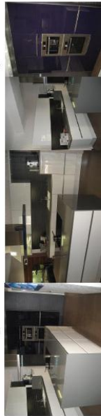
Weißer Hochglanz Küche inkl. Gratis Armatur und Spüle