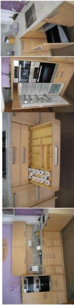
KORNMÜLLER KÜCHE „Valencia G9M“