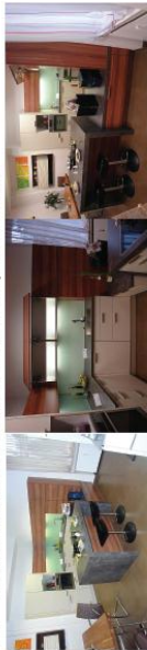
FM - AUSSTELLUNGSKÜCHE „Intra/Continua“