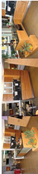
KORNMÜLLER KÜCHE „Pisa“ in Kirsch geölt, grifflos