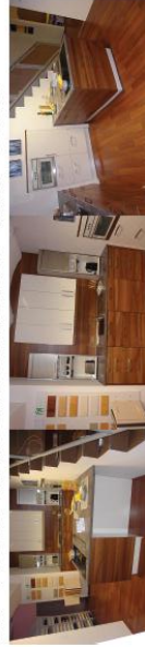
FM - AUSSTELLUNGSKÜCHE „Cameo“ inkl. E-Geräte