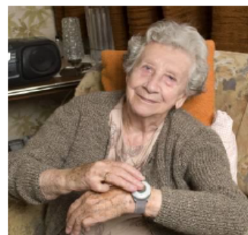
Auf Knopfdruck sind Sie in Notfällen mit der Notrufzentrale der Volkshilfe NÖ verbunden.

Entscheiden Sie sich jetzt für ein Notruftelefon und mieten Sie es für mindestens ein Jahr - dann ist das Notruftelefon für den Rest des Jahres 2011 kostenlos. Ab 2012 beträgt die Miete monatlich € 25,44. Es entstehen keine weiteren Kosten. Der Anschluss, das Service und die laufende Wartung sind in der Miete inkludiert.