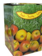
Bag in Box

und Sie haben Ihren Saft aus dem eigenen Obstgarten zu Hause für Ihre Kinder auf dem Tisch und kein mit Wasser verdünntes Konzentrat aus dem Regal! Einfach, frisch und gesund!