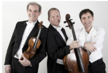
Altenberg Trio Wien