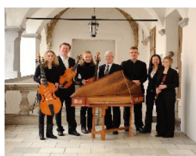
Audite Silete Musica

Joseph Haydn ist die inspirierende Quelle für das Musikfest Schloss Weinzierl. Das Programm spannt sich von Haydn bis Debussy und eröffnet einen weiten musikalischen Bogen: Kammermusik vom Feinsten in einem besonderen Ambiente: