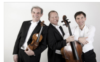
Altenberg Trio Wien