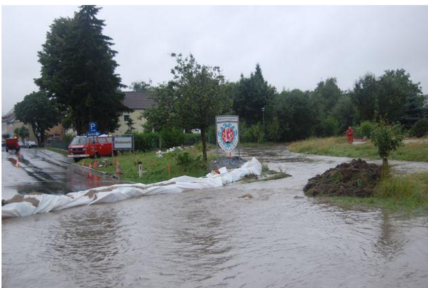
Fertiger Damm zur Umleitung des Blindbaches