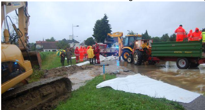
Errichtung eines Dammes entlang der Hauptstraße