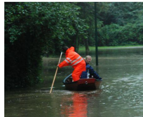
Anrainerbeförderung mit Zillen