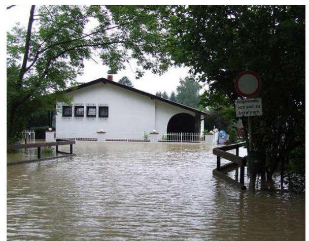
Überflutung Verbindungsstraße Ausee III