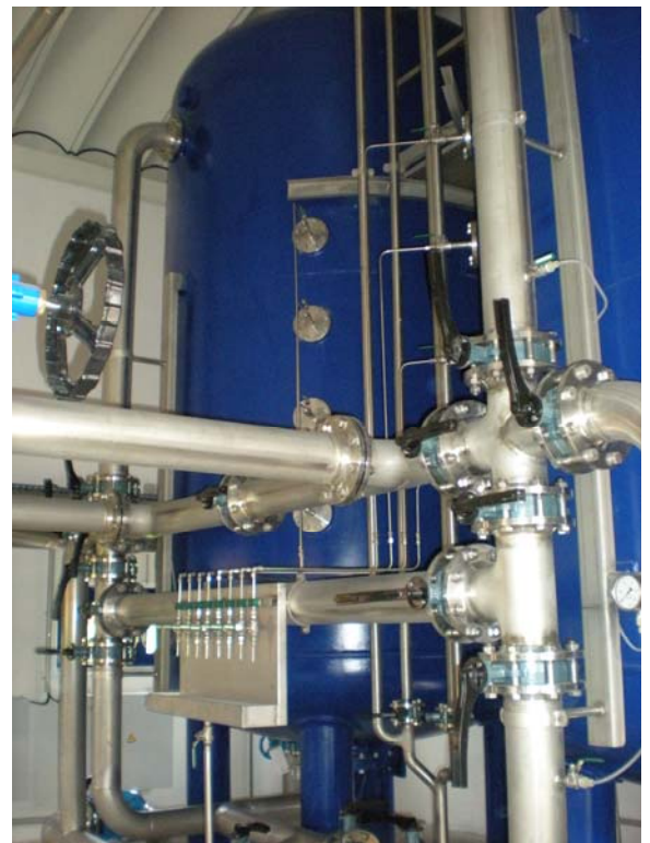
Aktivkohlefilter mit Wasseraufbereitung